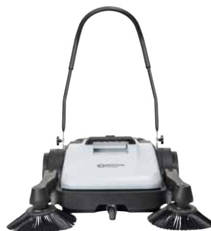
SW200 med én sidekost – og SW250 med to sidekoste – dækker en arbejdsbredde på hhv. 70 cm og 90 cm.

Den hurtige og produktive Nilfisk fejmaskine er ideel til rengøring i mindre fabrikker, parkeringsanlæg, indkøbscentre, skoler, værksteder, bus- og togstationer og udendørs arealer ved kontorbygninger.