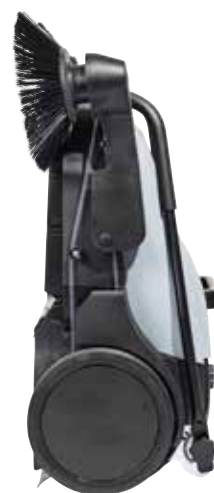
Det sammenklappelige håndtag og maskinens konstruktion bevirker, at smudsbeholderen forbliver på plads, selv når fejmaskinen opbevares opretstående eller hængende på væggen.