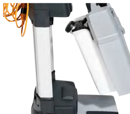
Begge tanke er letaftagelige og kan nemt bæres med én hånd.