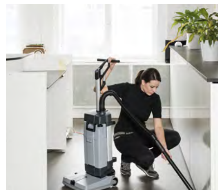
Den eksterne sugeslange (tilbehør til Basic-versionen) er velegnet til opsugning af væske på svært tilgængelige steder.