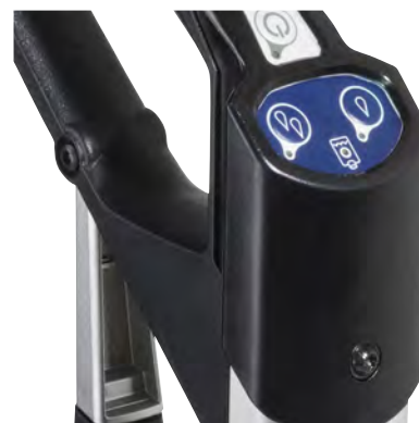
Det intuitive touch-display sikrer fuld kontrol over gulvvaskeren med to indstillinger af vandmængden og en advarselsslampe, der lyser ved tom tank.