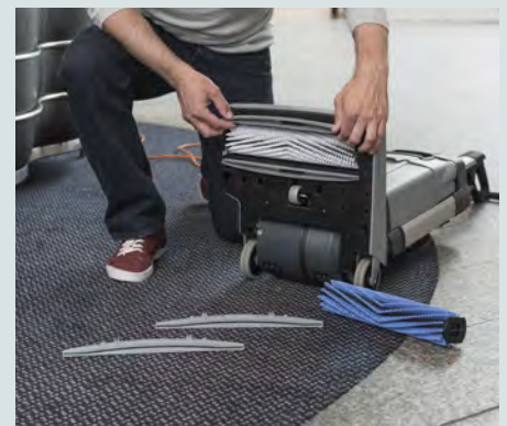
Foruden hurtigere rengøring af hårde gulve, kan maskinen også rense mindre tæpper og fjerne pletter ved brug af tilbehørssættet til tæpperensning. Børste og sugefod kan afmonteres uden brug af værktøj, så daglig vedligehold bliver hurtigt og let.