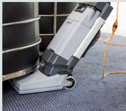
SC100 rengør med en frihøjde på kun 25 cm.