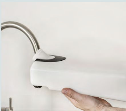
Rentvandstanken kan let fyldes med vand i enhver vask.