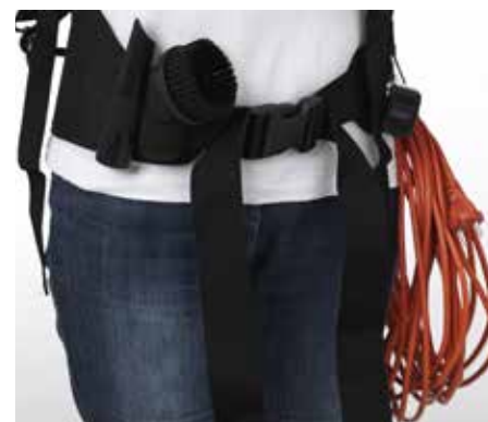
Tilbehør opbevares i bæltet, så det er nemt at få fat i