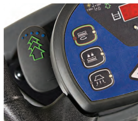
Ergonomisk rat med alle arbejdsfunktioner integreret.