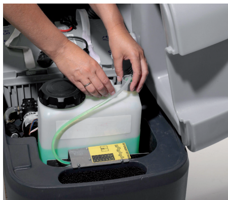
Ecoflex-kemidosering (tilvalg) styrer rengøringsmiddel-forbruget og sparer penge.

” Indbygget batterilader gør opladningen fleksibel (tilvalg) ”