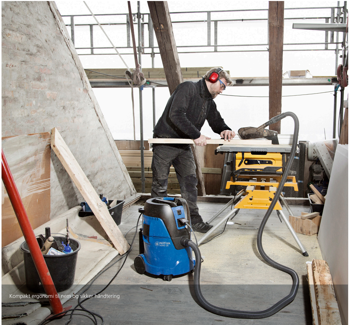
Kompakt ergonomi til nem og sikker håndtering

Våd-/tørsugerne er kompakte og nemme at anvende - det optimale valg til mindre rengøringsopgaver.